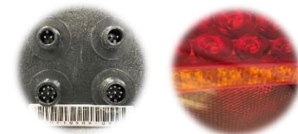
Feux LI® 2.2 : 2x8C F + 2x2C F

* Réalisez facilement votre faisceau complet sur mesure